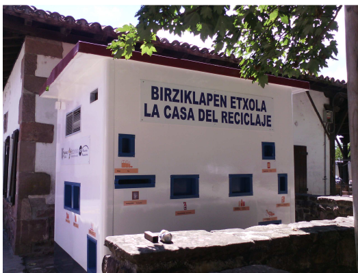
Casa de reciclaje de Baztan

Estas casas son casetas restauradas y reutilizadas como punto fijo de recogida de residuos, de manera que a partir de ahora estarán a disposición de todas las personas que deseen depositar allí sus residuos especiales. De momento han sido colocadas en Bortziriak y Baztan, pero se prevé la colocación de otra caseta en Malerreka para antes de fin de año.