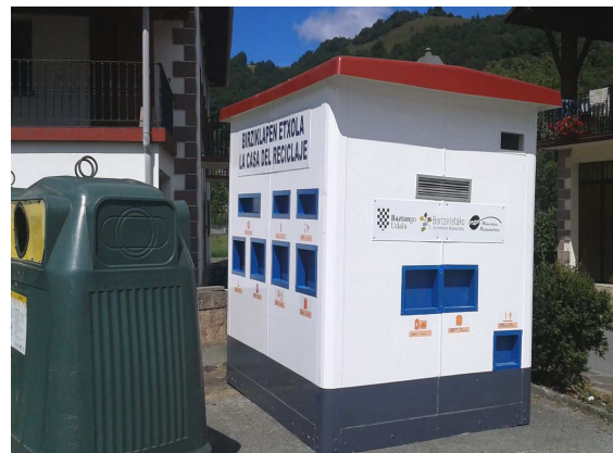
Casa de reciclaje de Bortziriak

La caseta de Baztan está ubicada en Elizondo, al inicio de la calle Jaime Urrutia, en la Plaza del Mercado, al lado de la máquina de leche y del contenedor para la recogida de ropa usada. La de Bortziriak está en Etxalar,