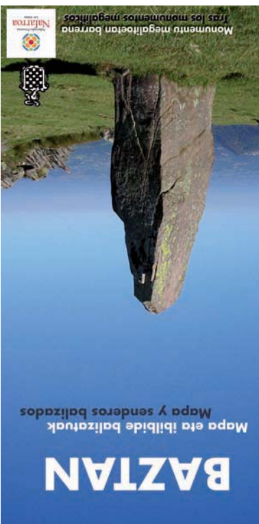
Monumentu megalitikoak Los monumentos megalíticos