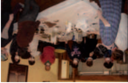
Curso de jabones. Amaitur.

no cuando y cómo se iban a realizar y el gasto que supondrían... todas esas cuestiones causaban dificultades a algunos pueblos y asociaciones culturales. Por consiguiente, se podrá realizar durante todo el año la solicitud de ayudas para la organización de cualquier actividad cultural.