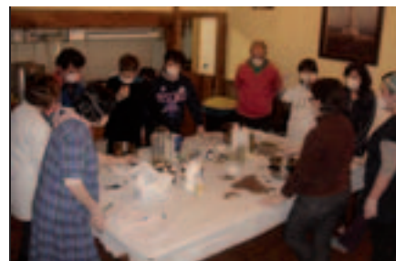
Xaboi ikastaroa. Amaiur