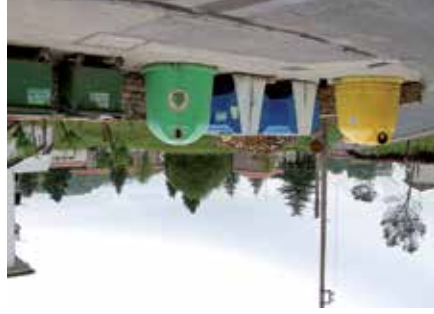
Contenedores en Elizondo

En virtud de la Directiva europea 2008/98/EC, el pasado año, el Gobierno de Navarra aprobó el Plan Integral de los Residuos Urbanos, según el cual para el año 2020 se va a reciclar el 50% de los residuos orgánicos; los residuos orgánicos propios deberán ser como máximo un 10% de dicha cantidad. El 40% de la basura que se produce en las casas corresponde a la fracción orgánica y, actualmente, se deposita en el contenedor verde, y mezclada con las demás basuras se vierte en el vertedero de Góngora. Hasta ahora, por cada tonelada vertida al vertedero, se pagaba 43 euros; en 2011, por ejemplo, se pagaron 188.777,75 euros y, de aquí en adelante, se prevé que el precio se multiplicará mucho la evidencia que se encarecerá mucho la recogida de residuos. Por otro lado, desde un punto de vista social, no se puede entender el que no se instale el mejor sistema de reducción de residuos para su recogida separada. Así, teniendo en cuenta las exigencias del plan del Gobierno de Navarra y la gran cantidad de basura orgánica doméstica