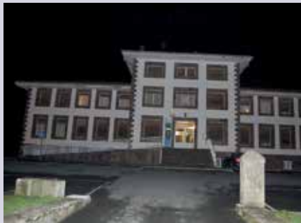
Elizondoko Osasun Zentrua

Akitzeko Osasun Etxeko ordezkariak zonaldeko larrialdietako zerbitzua nola geldituko den galdetu zuen. Nafarroako Gobernuaren erantzuna izan zen azkenengo planteamendua Oronoz-Mugairiko puntua presentzialetik lokalizatura pasatzea zela. Baztango Udaletik jakinarazi zitzaion arduragabekeria zela, erabaki honek osasun zerbitzuen erantzuna motelduko baitu.