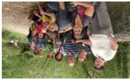
Grupo de Xauli paseando por Elbete

Desde la asociación BIDELAGUN sin dar cifras concretas señalan que les han recortado mucho las subvenciones para voluntariado, y que los requisitos de las convocatorias también se han endurecido y complicado. Notan también un retraso en los pagos; en concreto,