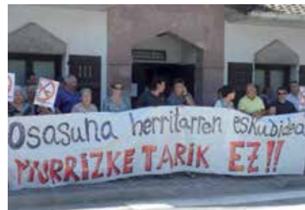
Murrizketen kontrako manifestazioa

Orain gutti Nafarroako parlamentuan alderdi guztiek aho batez Oronoz-Mugairiko larrialdietako arreta zerbitzua mantentzeko erabakia hartu bazuten ere, azkenean, Nafarroako gobernuak arreta-gune presentziala kendu eta lokalizatuan bihurtu nahi du. Baztandarrek dakiten moduan Oronoz-Mugairiko zerbitzutik Elizondoren hegoaldera dauden Baztango herritarrei zerbitzua ematen zaie, hau da, Lekaroz eta Arraiozko egiten duen Orabi-deako baserriei, Iruritaiko errekaioei Artesiagaraino, Baztango Basaburua guttiari Almandozko bigarren tunela artio, Irurita, Gartzain, Arraioz... Modu horretan zonaldea larrialdietako puntu bat guttiagorekin utzita herritarrei osasunerako oinarrizko eskubidea galarazten zaie baina gainera, osasun langileen lan-baldintzak makurtzen dira. Erabaki hau inguruko herritarrak, erakundeak eta osasun arloko profesionalen iritzia kontuan izan gabe hartu da; horrela Baztango udalak eragile desberdinekin izandako solasaldietan ikusi izan duena da, Oronozko larrialdietako zerbitzu presentziala ber-