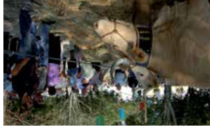
Feria de ganado

En cuanto al Plan Cuatrienal, hay que decir que tras varias reuniones y denuncias hemos conseguido que el Gobierno de Navarra destine una subvención al proyecto de abastecimiento de agua en alta de Iruña, aproximadamente 250.000 euros. Hay que mencionar que el Ayuntamiento de Baztan tiene preparado desde el comienzo de año el importe que le corresponde para acometer dicha obra. Sin embargo, aunque el Gobierno de Navarra en el último momento ha concedido una ayuda para los caminos, no lo ha hecho para el depósito de agua de Amañur.