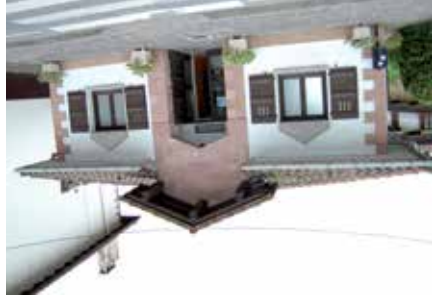
Centro de salud de Oronoz