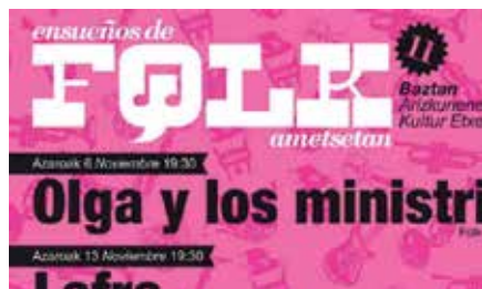
Folk Ametsetan 2011

COCEMF En kasuan ordea langilego kontratatua asko jaitسي behar izan