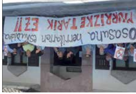
Mantestación en contra de los recortes