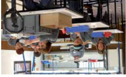
Trabajadoras/as de Tasubinsa

EGUZKILORE señala que está pagando la misma situación, a pesar de que no hay que olvidar que se trata de una asociación compuesta por un grupo de mujeres que trabajan como voluntarias.