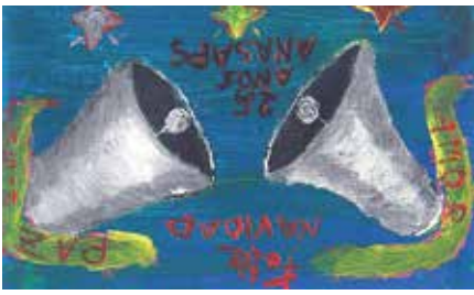
Postal ganadora concurso Anasaps

Desde AFINA remarcan, que con menos dinero, han conseguido mantener la oferta, sin subir la cuota de los socios. De la información detallada recibida de la Asociación se puede deducir que las convocatorias no han respetados los plazos y que al retrasarse mucho la valoración se han producido en la entidad situaciones de desconocimiento, dado que no han tenido muchas oportunidades de hacer previsiones.