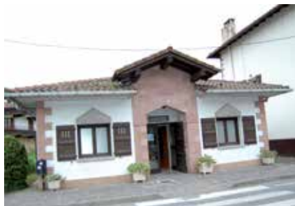
Oronozko Osasun Zentrua

Orain gutti Nafarroako parlamentuan alderdi guztiek aho batez Oronoz-Mugairiko larrialdietako arreta zerbitzua mantentzeko erabakia hartu bazuten ere, azkenean, Nafarroako gobernuak arreta-gune presentziala kendu eta lokalizatuan bihurtu nahi du. Baztandarrek dakiten moduan Oronoz-Mugairiko zerbitzutik Elizondoren hegoaldera dauden Baztango herritarrei zerbitzua ematen zaie, hau da, Lekaroz eta Arraiozko egiten duen Orabi-deako baserriei, Iruritaiko errekaioei Artesiagaraino, Baztango Basaburua guttiari Almandozko bigarren tunela artio, Irurita, Gartzain, Arraioz... Modu horretan zonaldea larrialdietako puntu bat guttiagorekin utzita herritarrei osasunerako oinarrizko eskubidea galarazten zaie baina gainera, osasun langileen lan-baldintzak makurtzen dira. Erabaki hau inguruko herritarrak, erakundeak eta osasun arloko profesionalen iritzia kontuan izan gabe hartu da; horrela Baztango udalak eragile desberdinekin izandako solasaldietan ikusi izan duena da, Oronozko larrialdietako zerbitzu presentziala ber-