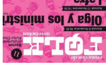
Folk Ametsetan 2011

Ha desaparecido la subvención para organizar el programa Folk Ametsetan. El Ayuntamiento de Baztan recibía unos 4.000 euros de dicha partida. De Arte y Cultura recibía también unos 6.000 euros, y la subvención correspondiente al pasado año la hemos cobrado ahora.