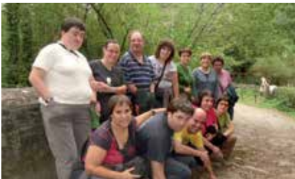
Xauli taldekoak Elbeten pasaletan

BIDELAGUN etik zenbaki zehatzak aipatu gabe, bolondreserako dirulaguntzak aunitz murriztu zaizkiela airtortzen dute eta deialdien baldintzak ere zorroztu eta zaildu egin direla aipatzen dute. Ordainketen atzerapena ere sumatzen dute eta entitate honetan ere 5-6 hilabeteko atzerapena dago zenbait kibraketerako.