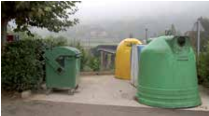
Arriaoren dauden zaborrontziak

Baztango udalak hiri-hondakinen bilketa tasen berrikusketan egin du eta, horrela, 2009. urtean tratamendu tasaren gorakadak eragindako arrangurak kontuan hartuta ordenantza gaurkotasuna da.