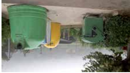
Contenedores en Arriaz

El Ayuntamiento de Batzán ha procedido a la revisión de las tasas de recogida de residuos urbanos; así, en el año 2009, ha actualizado la ordenanza, teniendo en cuenta la preocupación generada por la subida de la tasa de tratamiento el año 2009.