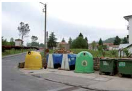
Elizondon dauden zaborrontziak

Nafarroako Gobernuak, Europako 2008/98/ec zuzentarauari jarraikiz, hiri hondakinen plan integrala onartu zuen lehengo urtean eta horren arabera, 2020 urterako hondakin organiko-en %50 birziklatu behar dira; organiko inpropioak kopuru horren %10 baino guttiago izan behar dute. Etxeetan produzitzen den zaborraren %40 organikoa izaten da eta, gaur egun, edukiontzi berderat botatzen da, gainerako zaborrekin nahasita Gongorako zabortegian botatzeko. Orain artio, zabortegirat botatako tona bakoitzeko 43 euro ordaintzen zen, 2011 an adibidez, 188.777,75 euro ordaindu ziren eta hemendik aitzinerat, prezioa biderkatzea aurrikusten da, horrek, bistan denez, hondakinen bilketa aunitz kario-tuko du. Bertzade, ikuspegi sozial batetik ez da ulertzen ahal, hondakinak guttitzeko eta bereizirik biltzeko sistema ahalik eta hoberena ez paratzea. Horrela, Nafarroako Gobernuaren planaren eskakizunak gogoan harturik eta etxeetan produzitzen den zabor orga-