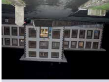
Centro de Salud de Elizondo

Para acabar, la persona representante del Centro de Salud presenció el servicio de urgencia de la zona. La respuesta del Gobierno de Navarra fue que de acuerdo con el último planteamiento Cronoz Mugairi pasaba de ser punto presencial a ser guardia localizada. El Ayuntamiento de Baztan recalco la irresponsabilidad de dicho planteamiento, dado que tal decisión debilitará la respuesta del servicio de salud.