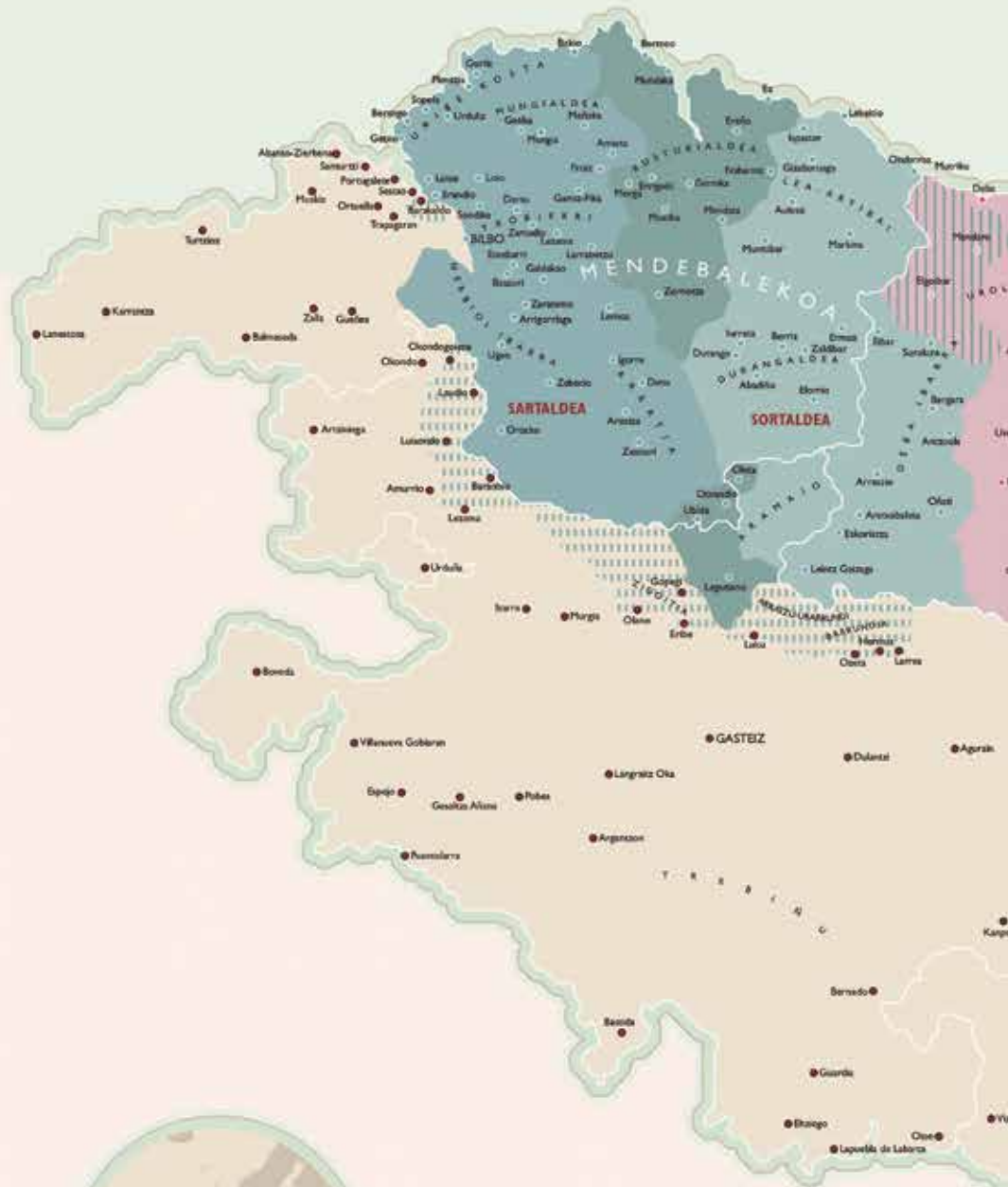
Euskararen eremuren mugak 1850-1870 opean (L.-L. Bonaparte)